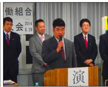
議長を務める一戸副執行委員長