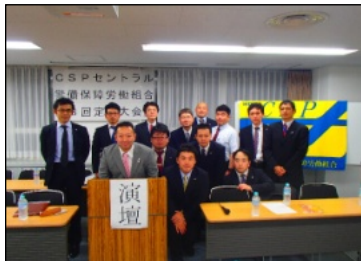
新旧執行部全員集合