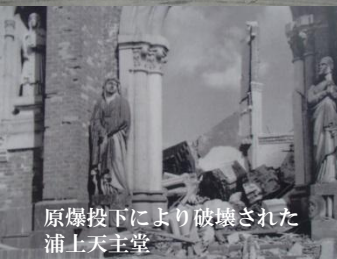
原爆投下により破壊された 浦上天主堂