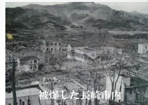
被爆した長崎市内