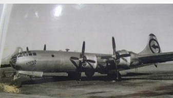
B-29 スーパーフォートレス 戦略爆撃機