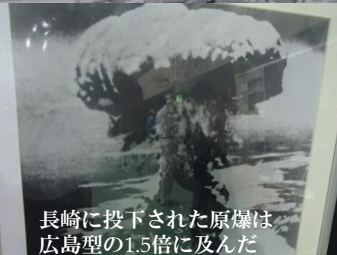
長崎に投下された原爆は 広島型の1.5倍に及んだ