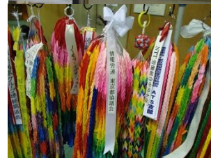
平和への願いが 込められた千羽鶴

情報労連主催の第24回長崎平和フォーラムが 8月7日から長崎市内で始まり、全国各地より情報労連 傘下の組合員が結集、CSPユニオンも参加しての総勢約3300人が被爆 の実相を伝える朗読劇などを通じて平和の尊さを学びました。