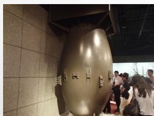
(写真上) 長崎県浦上地区に 投下された原子爆弾 ・ファットマン (原爆資料館にて)

フォーラム開催につき情報労連中央本部・春木書記長は、 この長崎での第24回平和フォーラムは情報労連平和4行動の 内の一つである。